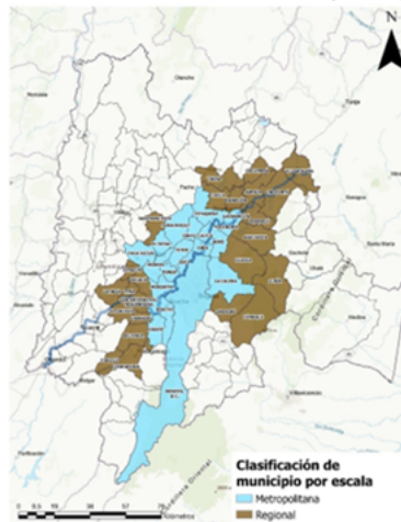
Mapa 1. Clasificación de municipios por escala

Finalmente, en cuanto a la escala departamental, debe precisarse que esta se analizará a nivel de provincias y corresponde al ámbito más general y amplio, en el cual la información será recopilada y analizada de forma agregada.